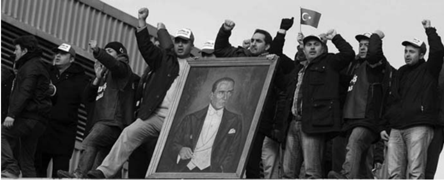
Demokratikleşmenin anahtarı, ulusu parçalayan etnisite ya da dinsellikte değil, sınıfların kendisindedir. (Fabrika işgal eden Şişecam işçileri)

lünmüş bir ülke gibi siyasal anlamda da güdülemesine olanak sağlar.