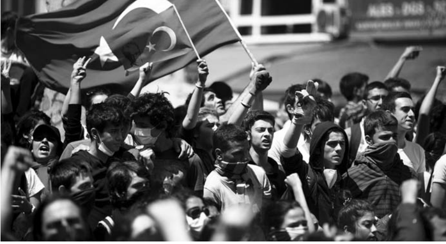
Ulus, bireyin soyu, dini ya da tarikati tarafından değil, yeni oluşturduğu ulus birliği tarafından korunduğu bir örgütlenmedir.

riyor. Sayın Erdost'a, bu öğretici seçkiyi tizlikle hazırladığı için çok teşekkür ediyoruz. Özellikle yoğun ideolojik saldırı karşısında kafası karışan genç kuşak solcuların, sosyalistlerin yararlanacağını düşünüyoruz. ( Bilim ve Ütopya )