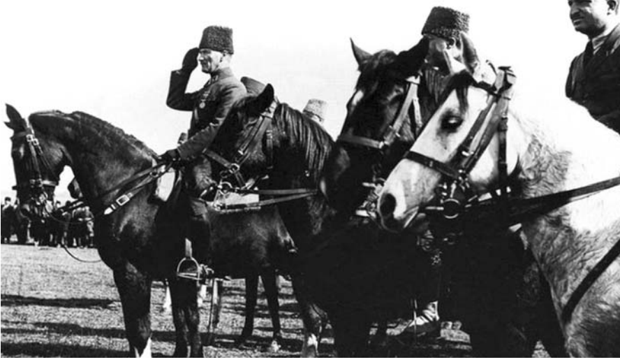
Kurtuluş Savaşı'nın ordusu, ulus olma, uluslaşma ve ulus temelinde bağımsızlaşma ve bütünleşme bilinciyle, din-dışı, yani laik kimlikli komutanların önderliğinde bir ordudur.

olarak, etnik ve dinsel ayrışmaya zorlamakta, ulus üzerinde var olduğu toprağıyla tarihe "uğurlanmak" için, din bütün alanlarda kullanılmaya çalışılmaktadır. Bu din, İslam dinidir. Kullananlar, İslamı, emperyalist sistemin ayaklarına seren İslamcılar, Museviler ve Hristiyanlardır. Ama hiçbiri dinsel kimlikleriyle görünmezler.