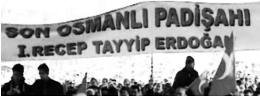
Öcalan henüz 1990'larda, tıpkı bugünkü "Yeni Osmanlılar" gibi, "Osmanlı sultanları olsa, Türkiye'de cumhuriyetten daha iyi bir rejim sürdürülebileceğini" öne sürmektedir.

lun!" demesi gerektiği yanıtını vermişti. "Politik çözüm" ise, Lozan'ın Kürtler açısından revizyonu ile ifade edilmişti. Şöyle diyenecekti: "Avrupa'nın Lozan Andlaşmasında (1923) sorumluluğu vardır. Kürtlere bu andlaşmanın revizyonunu borçludur. Bu andlaşmayla dört halk haritadan silinmiştir. Grekler, Ermeniler, Asurlar ve şimdi Kürtleri silmek istiyorlar." ( The Middle East , April 1999, s. 10)