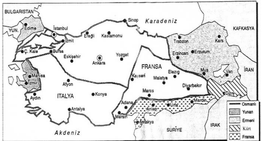
Öcalan'a göre, "Sevr'in Lozan'a bin kere değer"dir; "Sevr'de halkların kimlik hakları, Lozan'da faşizm" bulunmaktadır!