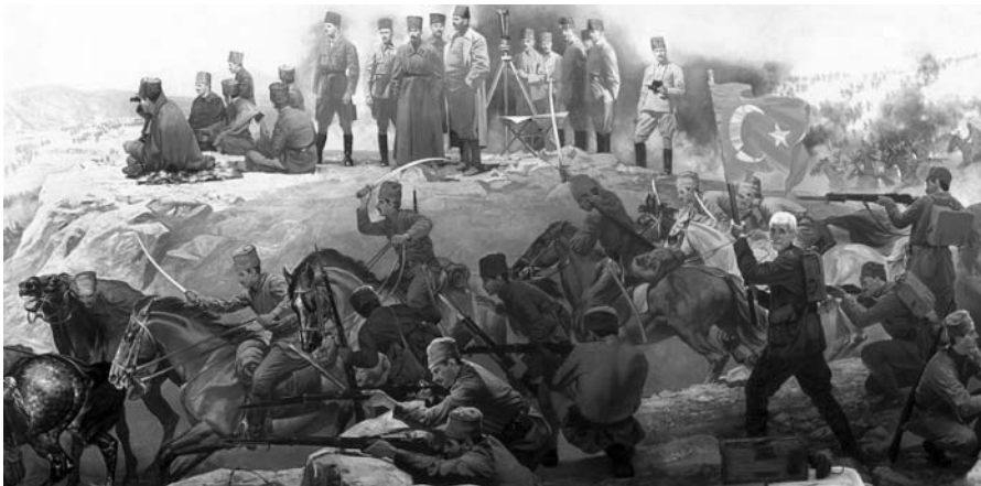
Kemalist devrim, teokratik ve feodal sınıf ve katmanlar ile ulusal ve demokratik sınıf ve katmanlar arası bir savaşı sınırlı değildir; ağırlıklı olarak ülkeyi dört bir yandan işgal eden düşmana karşı kazanılan Kurtuluş Savaşıyla simgelenir.

Burada “feodalizm”, klasik anlamda, tarikat ve cemaatlerin temsil ettiği ve her şeyden önce de siyasal yaşama kumanda etmeye çalışan bir feodalizmdir. İkincisi, tarikat ve cemaatleri, siyasal yaşamı belirlemeye yönelten, özünde din değil, uluslararası sermayeye kumanda eden emperyalist sistemdir. Emperyalist sistem, Türkiye odağında Avrasya'ya ve Ortadoğu'ya egemen olmak için, ön aşamada Türkiye'yi, bir üs, atlama tahtası, ileri karakol