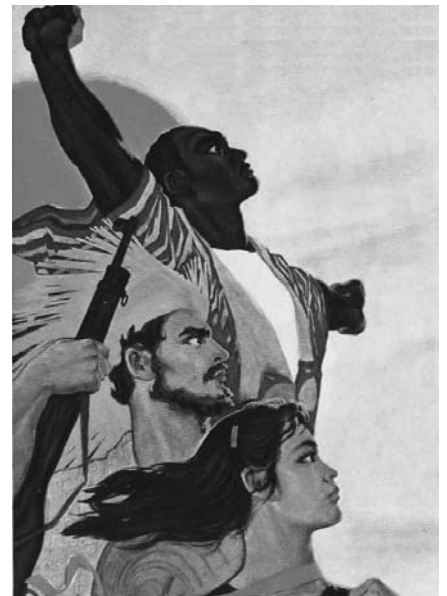
Ekim Devrimiyle açılan çağda, ulusal kurtuluş savaşları, emperyalizmi zayıflattığı ölçüde ilerici ve devrimcidir.

naklıdır. Bunun yolu ise sanayileşmedir. İster kapitalist biçim altında olsun, ister sosyalist biçim altında olsun ekonomik bakımdan bütünleşmemiş bir birlik, ulus-devlet olarak nitelense de, henüz ekonomik anlamda bütünleşmemiş bir ulus-devlettir. Kentsel alanın olduğu kadar kırsal alanın sanayileşmediği yerde, tam bir ekonomik bütünleşmeden ve dolayısıyla tam bir demokratik birlikten ve siyasal eşitlikten söz etmek olanaksızdır. Bu, aynı zamanda demokratikleşmenin eksikliklerinde kendini gösterir. Kırılabilir, ayrışabilir, ayrılabilir, çözülebilir bir “ulus”u, hem birlik olarak tutabilmek, hem kırılabilirliğin, ayrılabilirliğin, çözülebilirliğin üstesinden gelmeden birliği sürdürmek, şu ya da bu ölçüde, şu ya da bu durumda baskıyı da gündeme getirir. Baskı etnik ayrımcılığı, dinsel ve mezhepsel bölünmeyi, bölgesel farklılıklardan doğan negatif sorunları tetikler. Oysa ulus olmak, eski ve geleneksel birimleri aşmak, geleneksel ilişkilerden modern ekonomik yapıya devrimcileşmek, soysal, kastsal, zümresel sınıflaşmanın aşılması, modern ekonomik sınıfların belirleyici olduğu yeni bir yapılanmaya dönüşmek demektir. Sınıfsal niteliklerin, etnik ve dinsel özelliklerin arkasında kaldığı, emekçilerin geleneksel yapılarına göre yeniden bölündüğü, tarikat ve cemaatlerin emekçileri birbirleriyle karşı karşıya getirdiği bir çözümlenme, ulusu içten içe dağıtır, emperyalizmin ülkeyi bö-