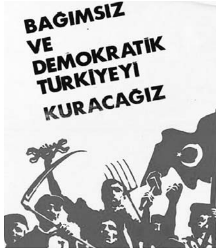
"Tam bağımsız gerçekten demokratik Türkiye" sloganında açıklanan "Milli Demokratik Devrim" anlayışı, devrim aşamasıdır.

Bununla kalınmadı, ülke, suyundan toprağına hemen her şeyiyle satılığa çıkarıldı. Babalarının malı gibi sattıklarını söylediler. Halk, paranın dini imanı olmaz der, Başbakanları, ilkin sermayenin dini, mezhebi, ırkı olmaz diyecek; ulusu, dinle, mezheple, ırk topluluğuyla karıştıracak; birkaç gün sonra, yanlısını, küresel bir yanlıyla taçlandırarak, "Türkiye'de sermaye ayrımı