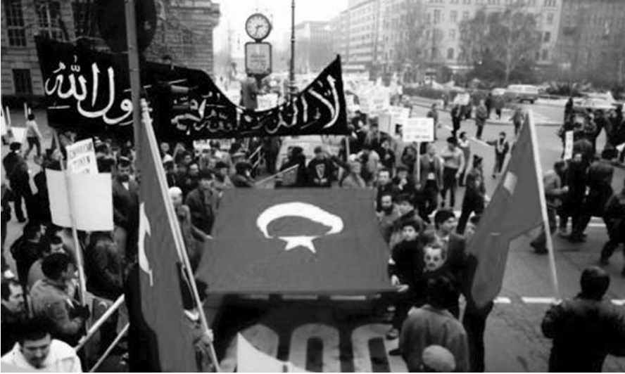
Alman istihbarat örgütü, Türk göçmenler arasında faaliyet gösteren İslamcı örgütlerin Batı değerlerine bağlı gibi görünseler de, "amaçlarının Türkiye'deki laik sistemi yıkarak, yerine İslamcı bir sistemi yerleştirmek" olduğunu belirtmektedir.

layarak, Avrupa'da çok etkili bir hareket haline gelmiştir. Başta Almanya olmak üzere, Avrupa'daki her ülkede camiler, yardım kuruluşları ve İslamcı dernekler ağı ile örgütlenmişlerdi.(12)