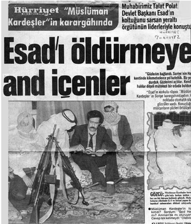
İslamcıların "Hama katliamı" dedikleri ve Hafız Esad'ı suçladıkları olaylar, 1982'de gericilerin ayaklanarak Hama'daki Baas yetkilileri ve Alevileri katletmeleri üzerine başlamıştı...

Şubat 2013 tarihinde, evinin önünde öldürüldü. Gannuşi'nin İslamcılarının sabırlı olmaları gerektiği yolundaki telkinleri, MK yönetiminin baskılarını durduramıyordu,