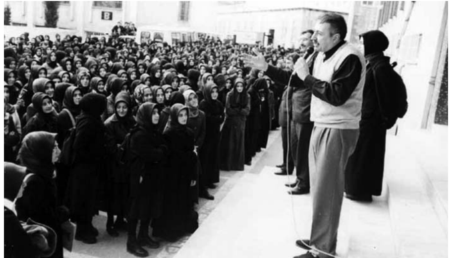
Türkiye'de İslamcılığın dönüm noktalarından biri, 12 Eylül Amerikancı faşist darbesiyle birlikte imam hatip okullarının sayısının ikiye katlanmasıdır.

Müslüman Kardeşler 'in Türkiye ile bağlantısı Milli Türk Talebe Birliğinin (MTTB) altmışlı yıllarına kadar uzanır. MTTB'nin yerine geçen ve kısa sürede 1800 şube ve 350 bin üyeye ulaşan Milli Gençlik Teşkilatıyla ilişkiler, Milli Görüş Teşkilatının 1985 yılında Köln'de kurulmasıyla üst düzeylere ulaştı.