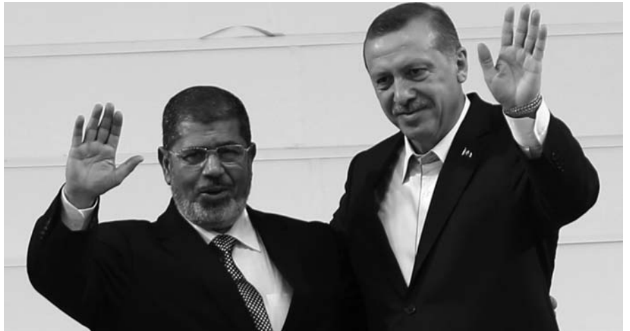
Devrik Müslüman Kardeşler lideri Mursi’ye göre, Hıristiyan ve Yahudiler, “ millet ” değil, onlar “ domuz ve maymun torunu ”!

Devlet, İslamlaştırmanın tek hedefidir ve İslam’ı tanımlamak için bir yetkili