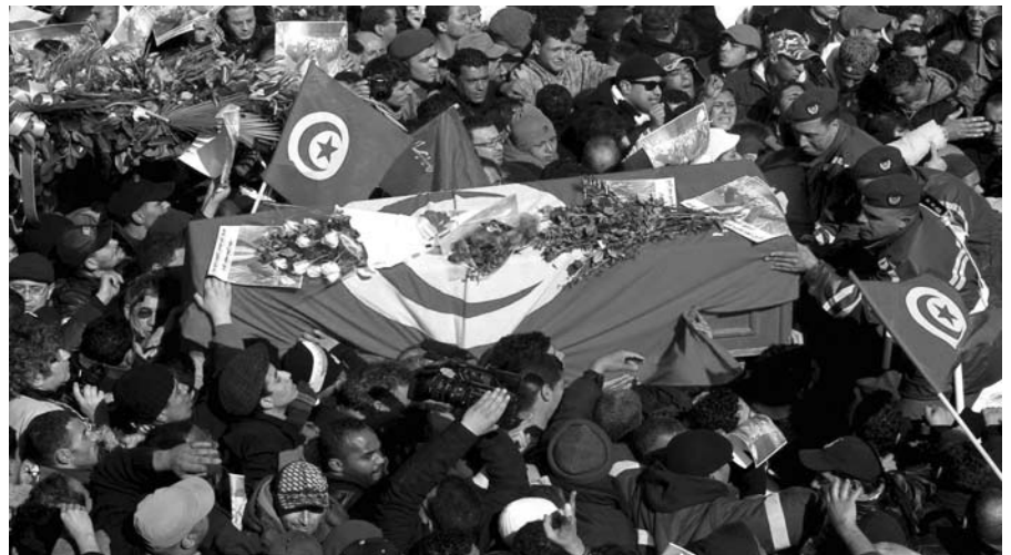
İslamcıların şiddeti IŞİD'le sınırlı değil! Gericiliğe karşı mücadele eden Tunuslu Marksist-ulusalçı Şükrü Belayid, geçen yıl Müslüman Kardeşler militanlarınca öldürüldü.

Demokratik Yurtseverler Partisi'nin genel sekreteri ve Halk Cephesi'nin önemli liderlerinden biri, Şükrü Belayid 6