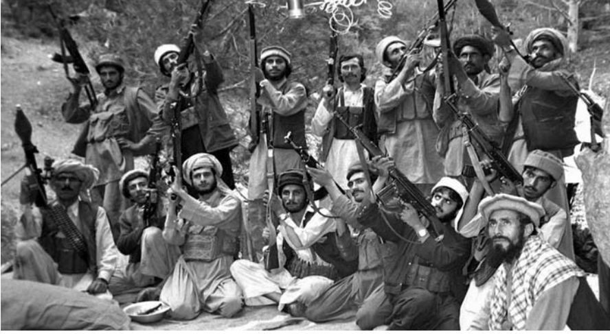
Sovyet işgaline karşı ABD'nin ve Suudi Arabistan'ın desteğini alan Afgan mücahidlerin zaferi, İslamcı siyasetin uluslararası bir kimlik kazanmasını sağladı.

otorite kullanımı söz konusudur. İslamcı hareketler ancak devlet gücünü ellerine geçirirlerse, başarılı sayılabilirler. İslamcı görüşlerin, modern devleti gerçek İslamcılığın önünde bir engel olarak gördükleri söylenebilir. Güce eriştikten sonra ülkenin kamu memurlarıyla, bürokratlarının yaklaşık yarısını işten atmış oldukları dikkate ele alınırsa, modern politik güçlere karşı kullandıkları yöntem de anlaşılabilir.