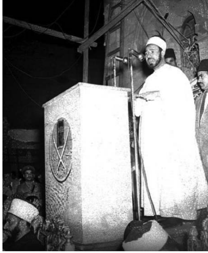
İhvan'ın kurucu önderi al Banna'nın, henüz 1940'larda ABD'li diplomatlarla irtibata geçtiği bilinmektedir.

İsviçre'de yaşayan Tarık Ramazan'ın sivil toplum örgütlerinin seçkin bir davetlisi olarak, Türkiye'de ağırlandığını biliyoruz.