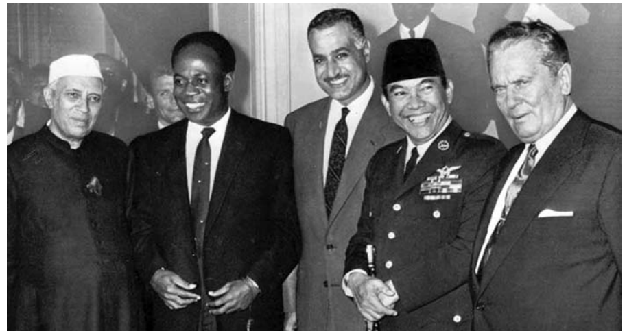
Mısır'ın ulusalcı lideri Nasır (ortada), Bağlantısızlar Hareketi'nin liderleri Hindistanlı Nehru, Ganalı Nkrumah, Endonezyalı Sukarno ve Yugoslav Tito ile birlikte... Batıya kafa tutan Nasır, karşısında Müslüman Kardeşler terörünü bulmuştu.

MK 'in siyasal tavırlarındaki esneklik son derece ilginçtir. Mısır'da Faruk başa geçince onu desteklemişlerdi. Nasır'ın darbesini alkışladılar, Nasır Batı'ya kafa tutunca muhalefete geçtiler, iki suikast girişimi sonuçsuz kalınca da, liderleri hapse atıldı, kaçabilenler, Suudi Arabistan'a sığındı.