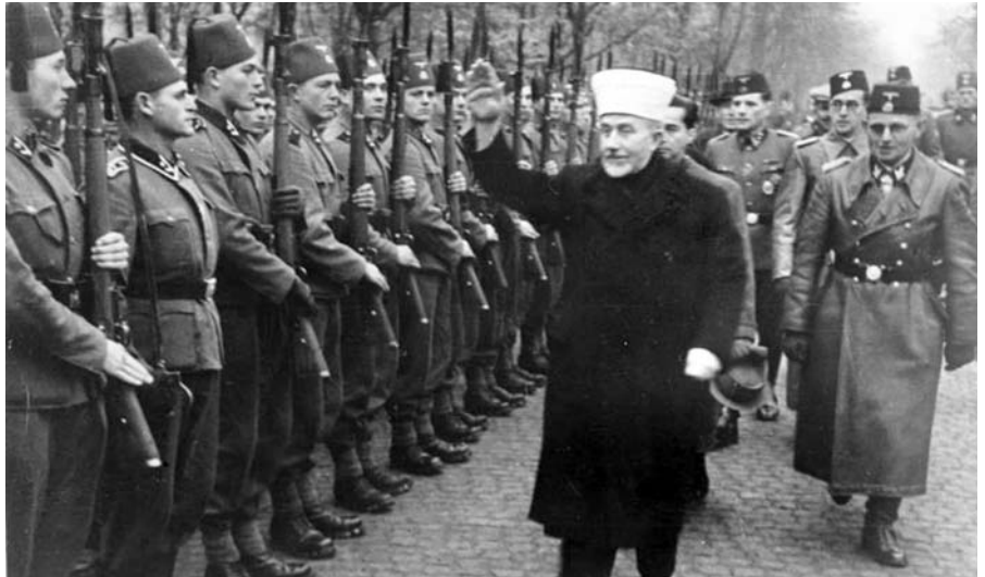
Müslüman Kardeşler 'in önemli dini liderlerinden Hac Amin el-Hüseyin, Nazi ordusunun Boşnak gönüllülerini Hitler selamıyla teftiş ederken... (1943)

Hareketin ideologu Seyyid Kutub, İslam şeriatı yasalarıyla yönetilmeyen rejimlerin yıkılması gerektiğini söylüyordu. Önceleri destekledikleri Nasır'a suikast